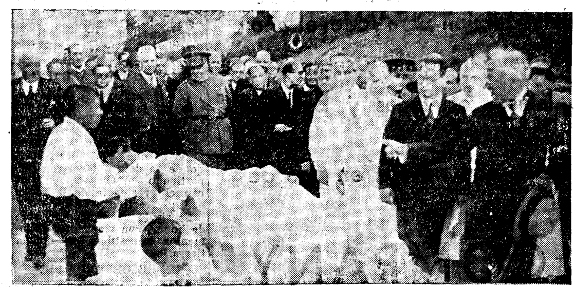
EL PRESIDENTE Y EL CORTEJO EN EL SANATORIO DE OZA

Dos poesías de Curros me han producido una enorme impresión: es la primera aquella, de ordinario amanerada, habitualmente fría, clásica y retórica que en él es ternura, desbordamiento del alma; la introducción a sus poesías en gallego. En ella se plantea la alternativa, la duda angustiosa de si el gallego es una lengua de rincón o si será, en la ilusión de su espíritu, lengua universal. Y cuando el hombre que canta el progreso y siente la fraternidad de toda la tierra, quiere resol-