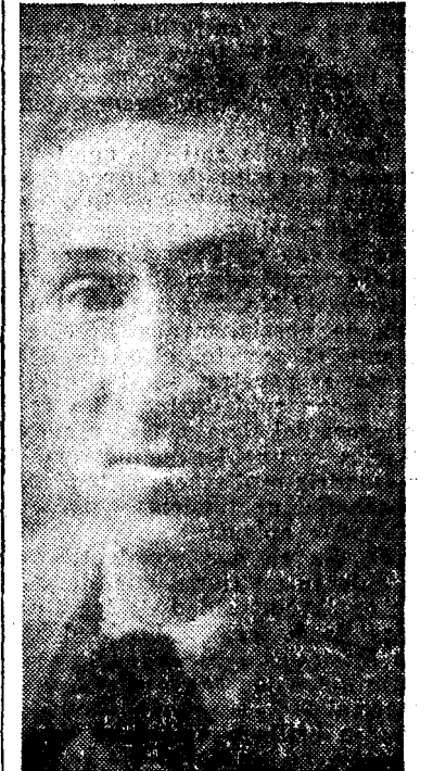
FRANCISCO ASOREY. El ilustre escultor, genial artista, autor del simbólico monumento inaugurado

Poeta civil, poeta político, poeta representativo, poeta simbólico. ¿Por qué? Así como en lo íntimo de nuestro ser se mezclan los tejidos y en la entraña de la naturaleza se combinan los minerales, en la esencia de la poesía, donde el género puro apenas si puede darse sin una frialdad académica y rectitud