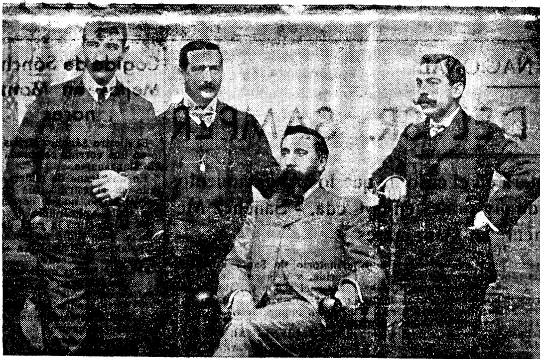
CURROS ENRIQUEZ EN LA CORUSA EN OCTUBRE DE 1904

Tres memorables fechas: tres gloriosas efemérides.